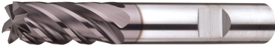
Abgestimmter Fräser mit TiAlSiN-Beschichtung