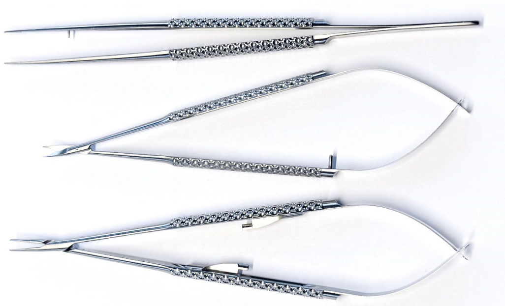
Mikrochirurgische Instrumente von MICROMA